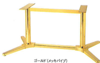
ゴールド(メッキパイプ)