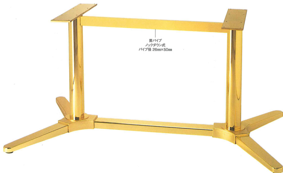
TABLE LEG 一文字脚・テーブル用