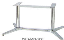
クローム(メッキパイプ)